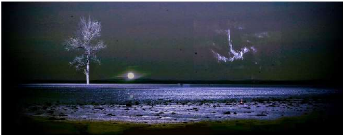
De werken van Geert Verbist zijn te bezichtigen in het klooster van de Franciscanessen.

Van Galerie Stom is het maar de straat oversteken naar het klooster van de Franciscanessen, het historische Besloten Hof. Daar stelt Geert Verbist zijn eigen creaties tentoon. "Het zijn uitgelichte fotobeelden die geïnspireerd zijn op foto's van de Hubble-telescoop van de NASA."